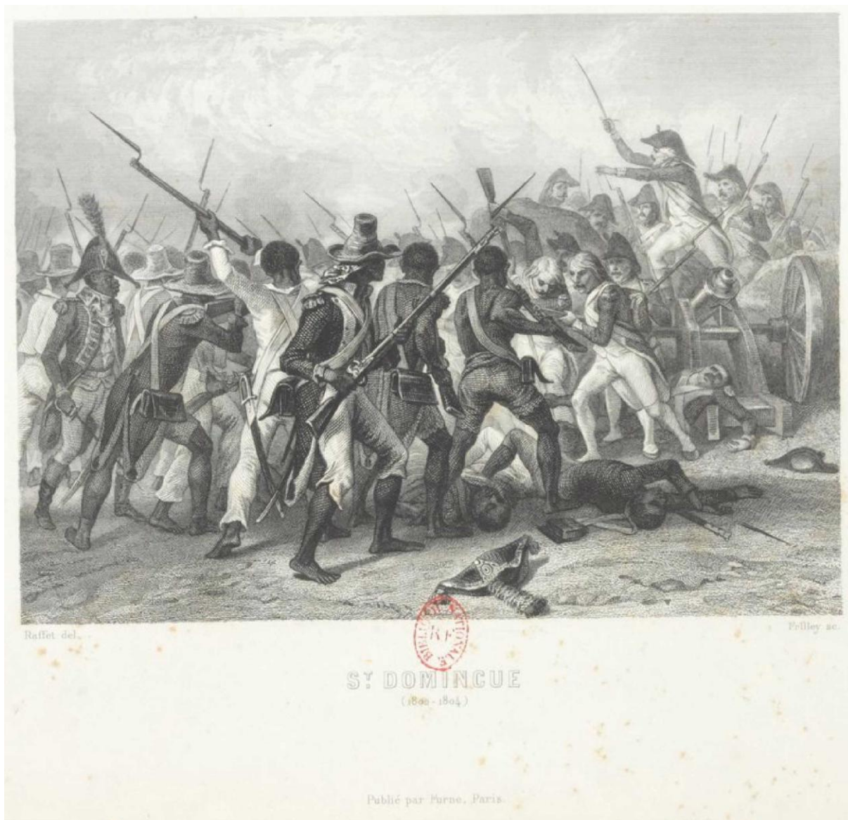
“ Saint-Domingue ”, illustration horizontale, dans THIERS , Vignettes et portraits pour le Consulat et l'Empire (1845)