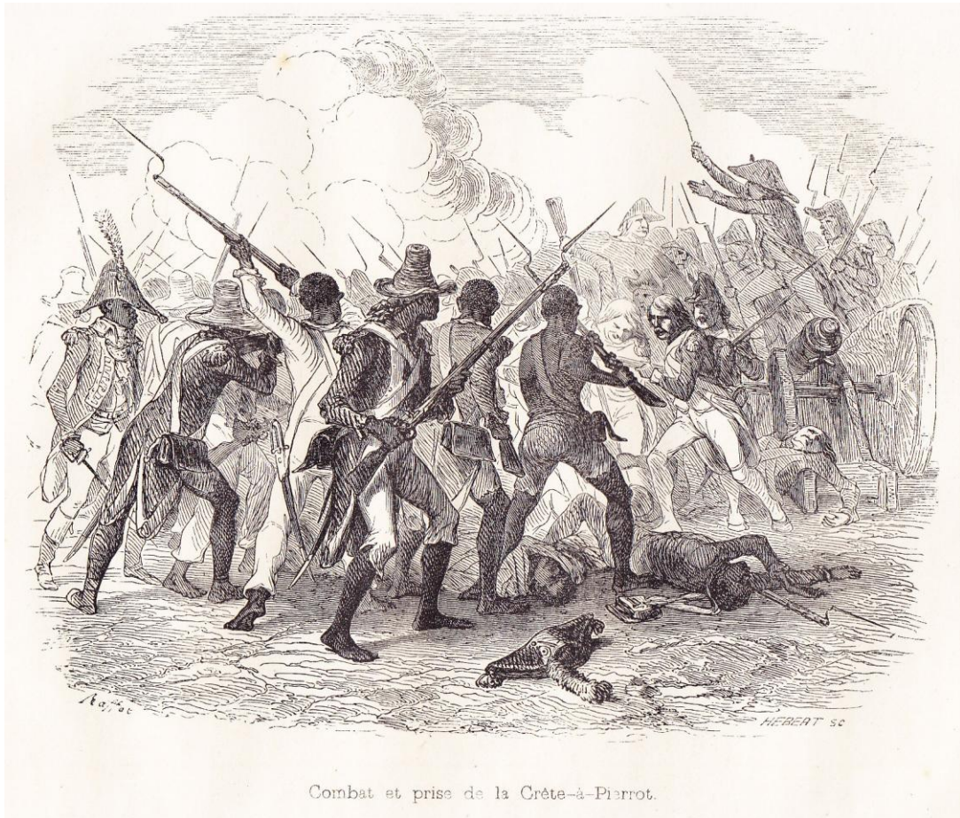
Combat et prise de la Crête-à-Pierrot.

“ Combat et prise de la Crête-à-Pierrot ”, illustration horizontale, regravée (?), hors-texte intercalé entre les pages 238 et 239 de NORVINS , Histoire de Napoléon (éd. belges de 1839 et 1841).